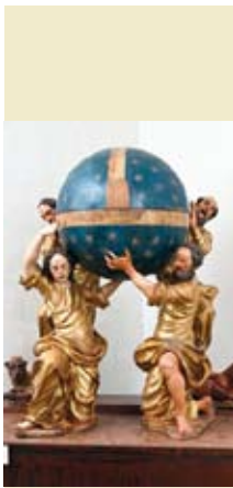
San Fermo, chiesa dei Santi Fermo e Rustico