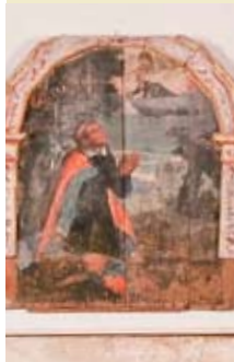
Pedeserva, chiesa di San Liberale

Belluno, Seminario Gregoriano, cappella gotica Da ammirare i magnifici capitelli con gli stemmi di alcune famiglie nobili bellunesi e le chiavi di volta che ornano i soffitti della sala