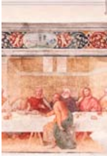
Cusighe, chiesa di Sant'Aronne