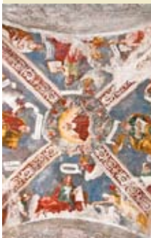
Mussoi, chiesa di Santi Filippo e Giacomo